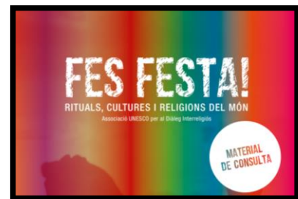
Fes festa! Rituals, cultures i religions del món. Material per a l'alumnat i el professorat (AUDIR)