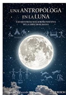
Una antropòloga en la luna Noemí Villaverde Maza (Libros Singulares)