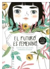
El futuro es femenino: cuentos para que juntas cambiemos el mundo (Nube de Tinta)