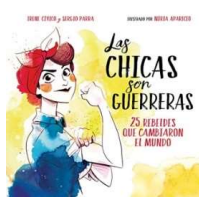
Las chicas son guerreras: 25 rebeldes que cambiaron el mundo (Ed. Montena)