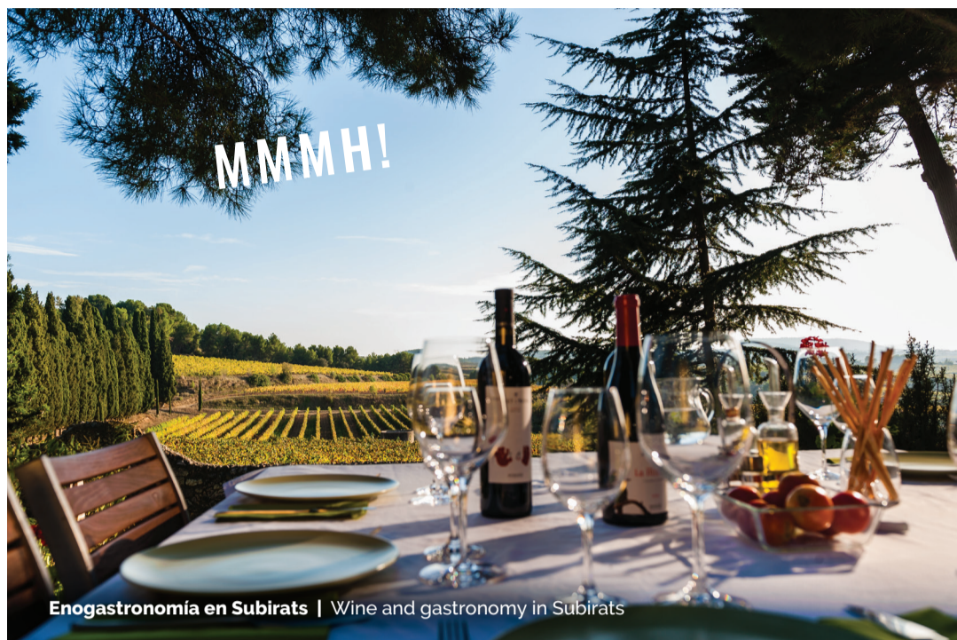
Enogastronomía en Subirats | Wine and gastronomy in Subirats