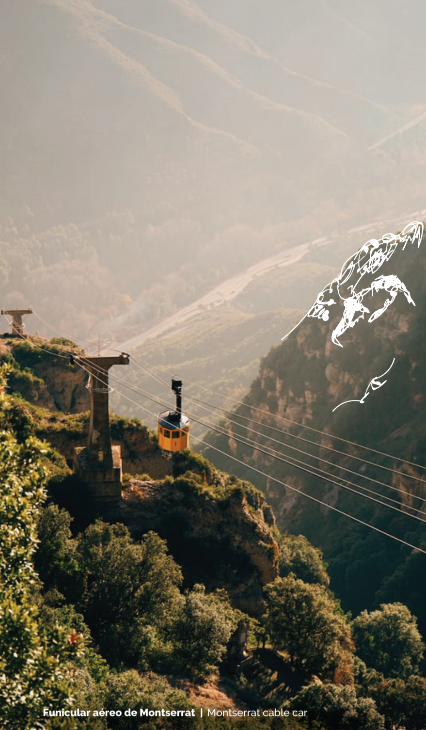
Funicular aéreo de Montserrat | Montserrat cable car