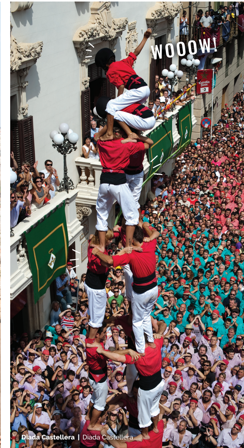
Diada Castellera | Diada Castellera

You'll like it so much, you'll no doubt want to share your experience, because Barcelona is much more. Join us as we invite you to discover its many corners, music, flavours, people... Welcome, our house is your house!