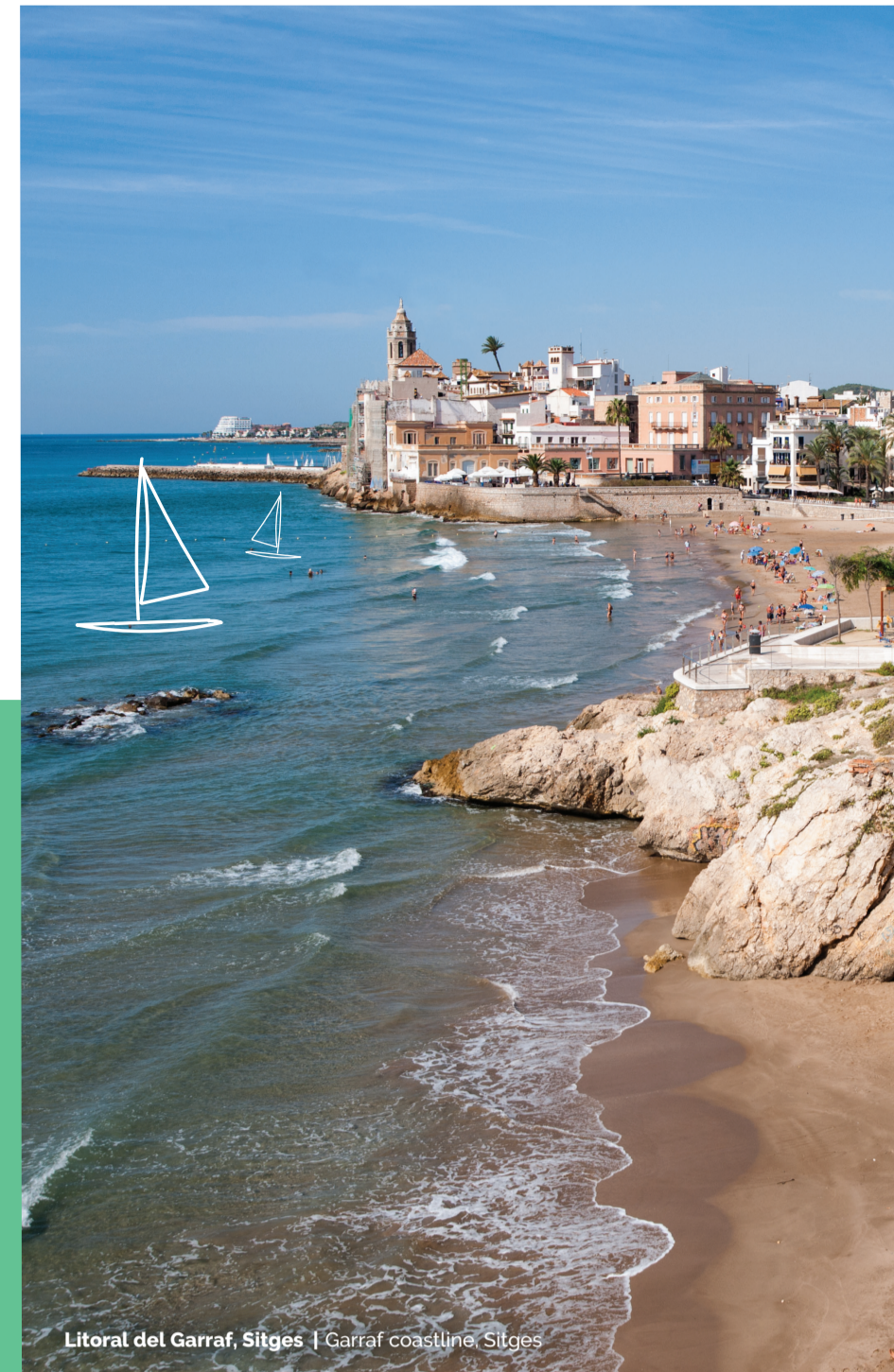
Litoral del Garraf, Sitges | Garraf coastline, Sitges