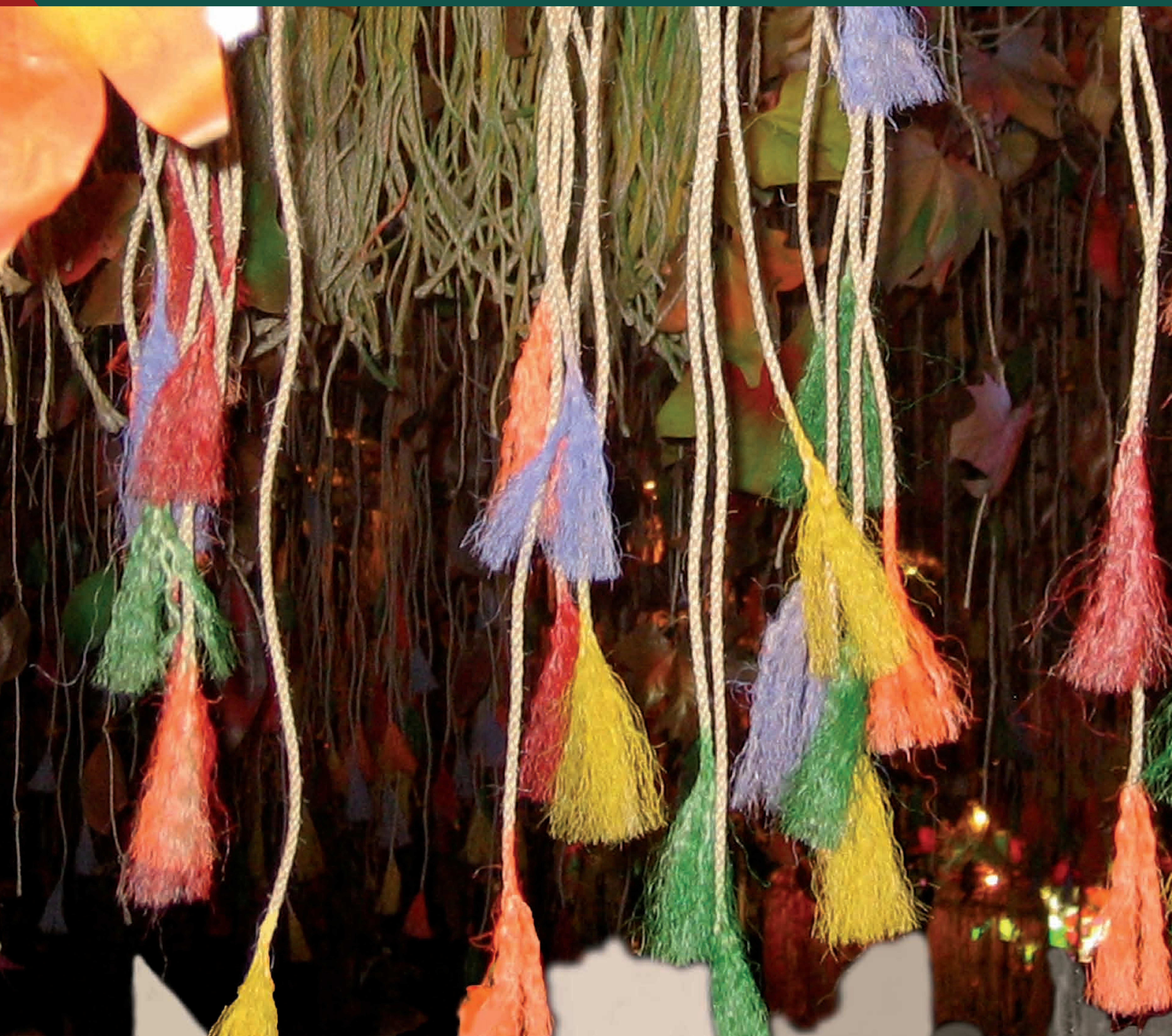
Guarniment de Festa Major, carrer de Joan Blanques de Dalt, Gràcia, 2008. Comissió de festa de carrer, Festa Major de Gràcia, 1945.