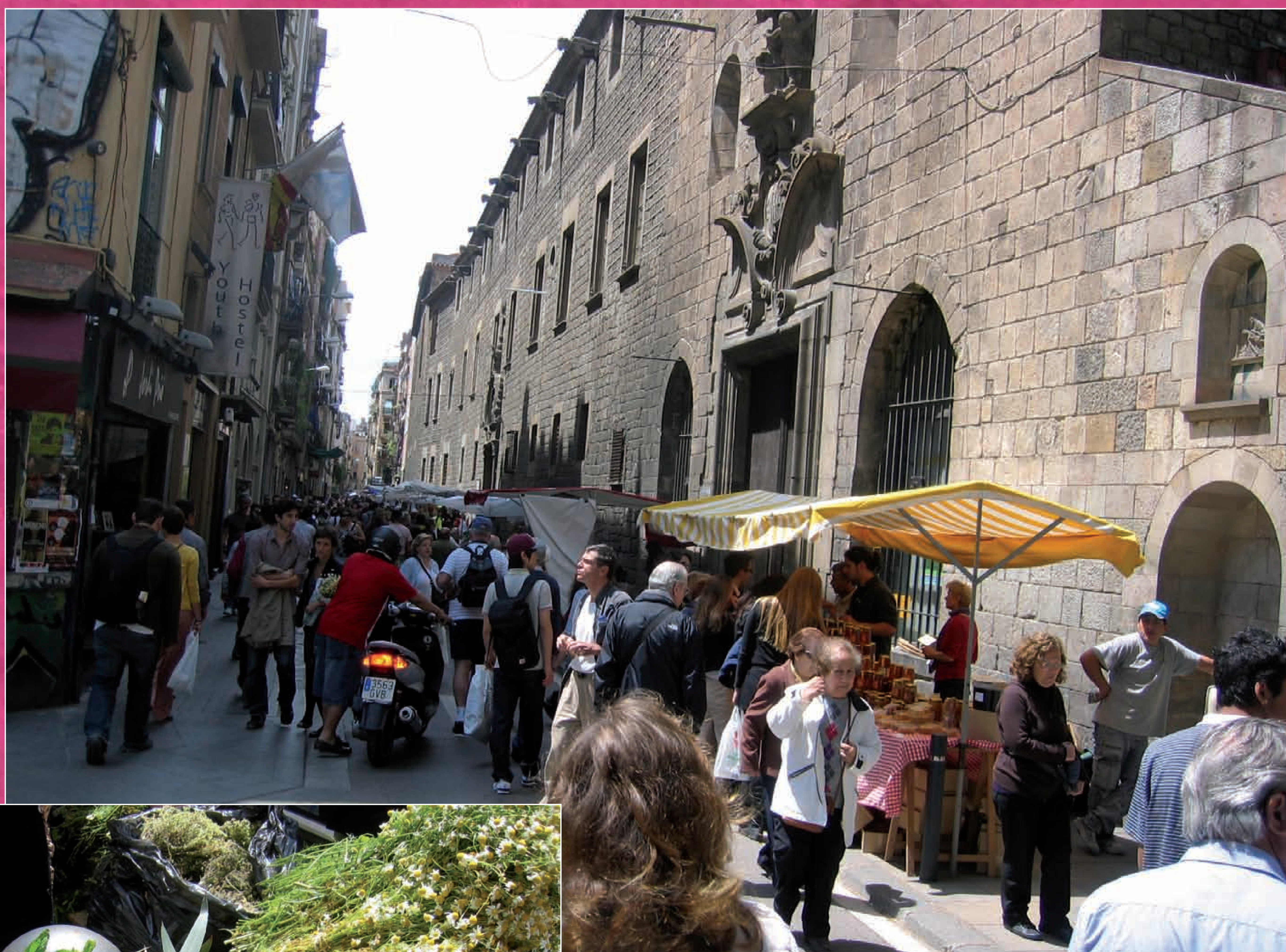
Fira de Sant Ponç. Barcelona, 2010.