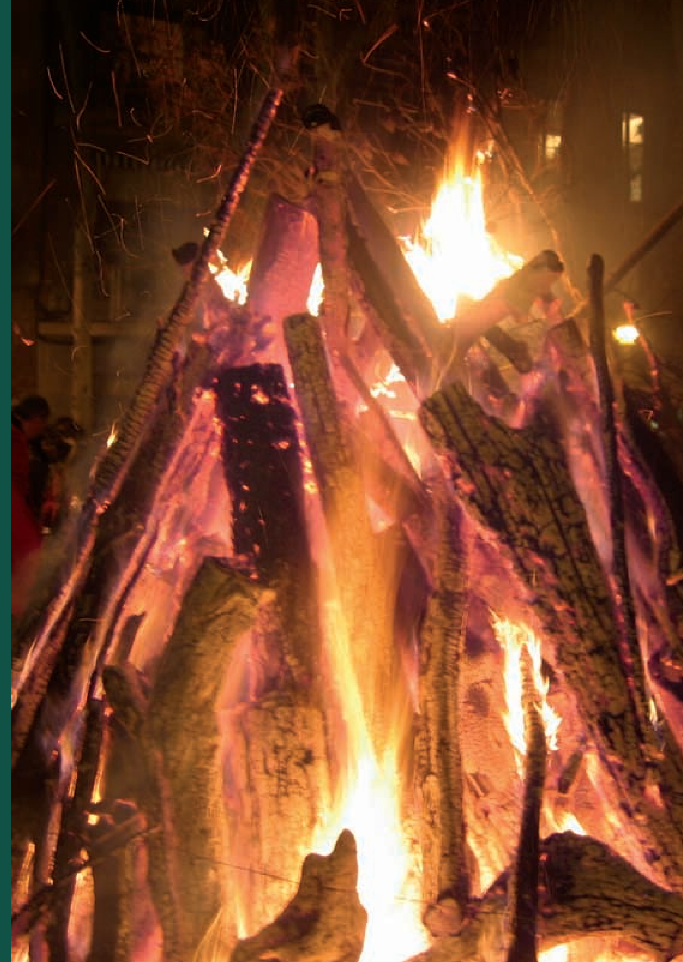
Fogueró de Sant Antoni. Revetlla mallorquina de Sa Pobla, 2011.

Aquesta exposició proposa un itinerari conceptual de la mà de la gent que fa les festes, els altres patrimonis.