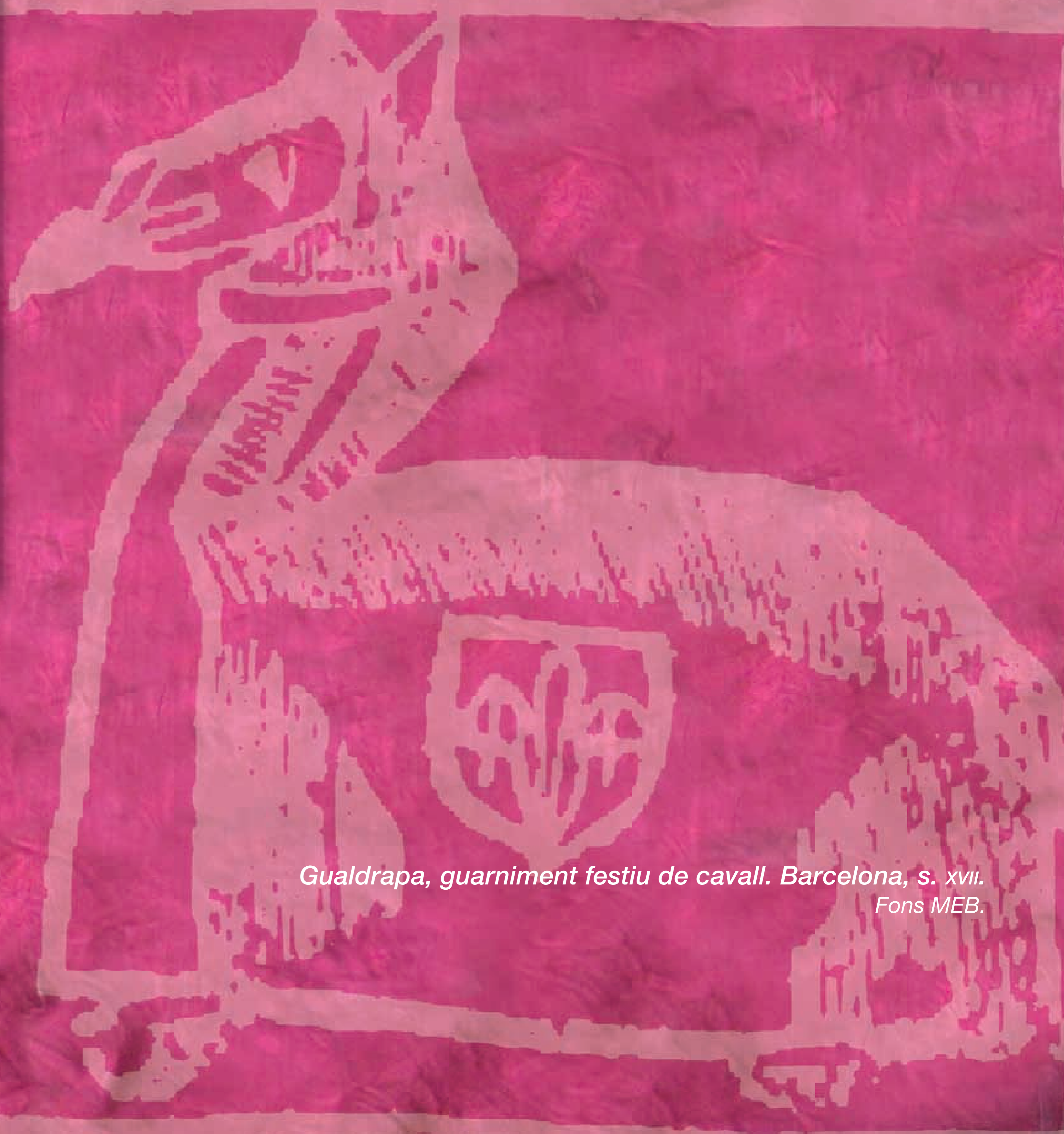
Gualdrapa, guarniment festiu de cavall. Barcelona, s. XVII. Fons MEB.