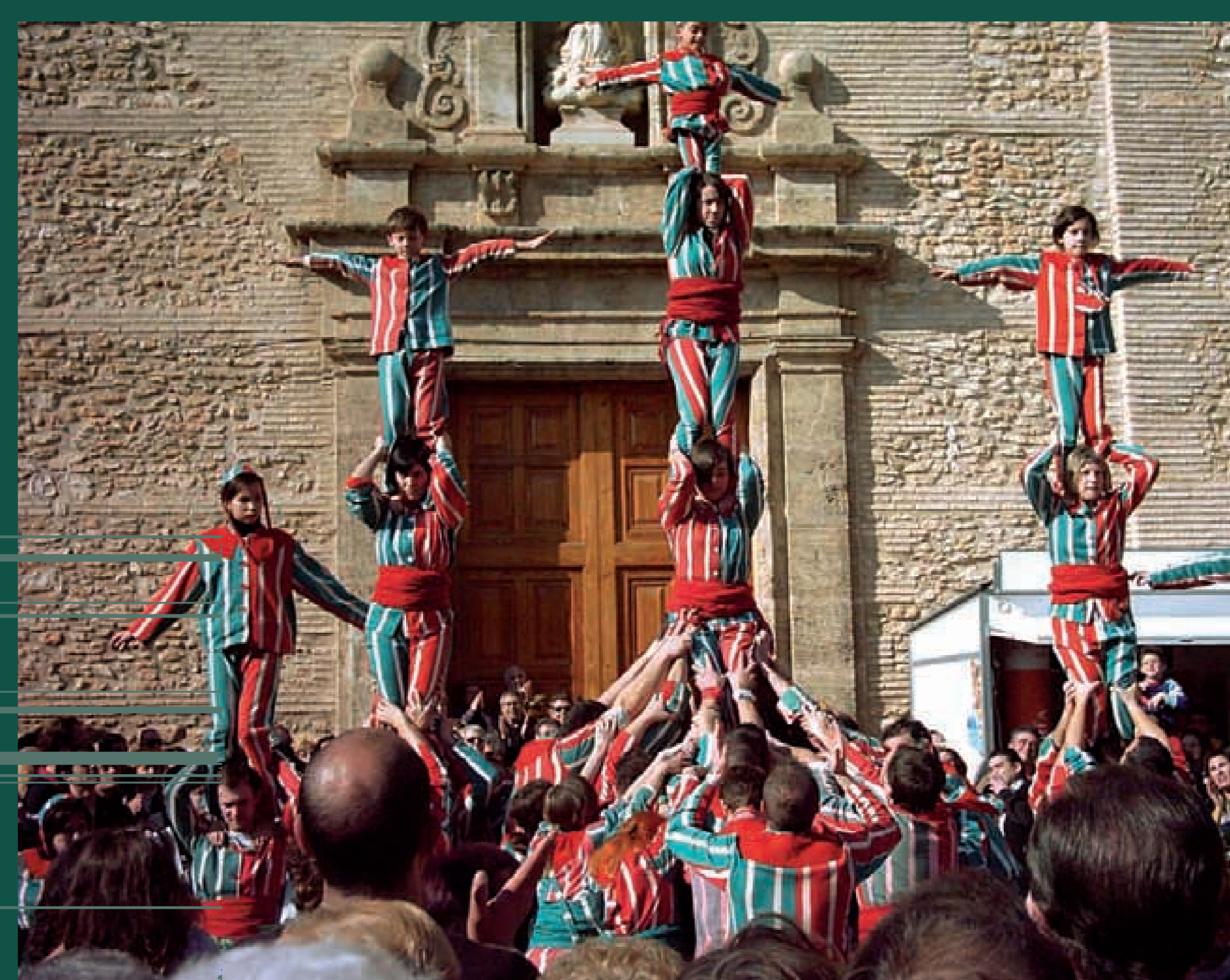
La Nova Muixeranga d'Algemesí, 2011.

La seva música vibrant, interpretada amb dolçaines i tabalet, ha estat considerada un himne als Països Catalans. Avui és patrimoni de la humanitat.