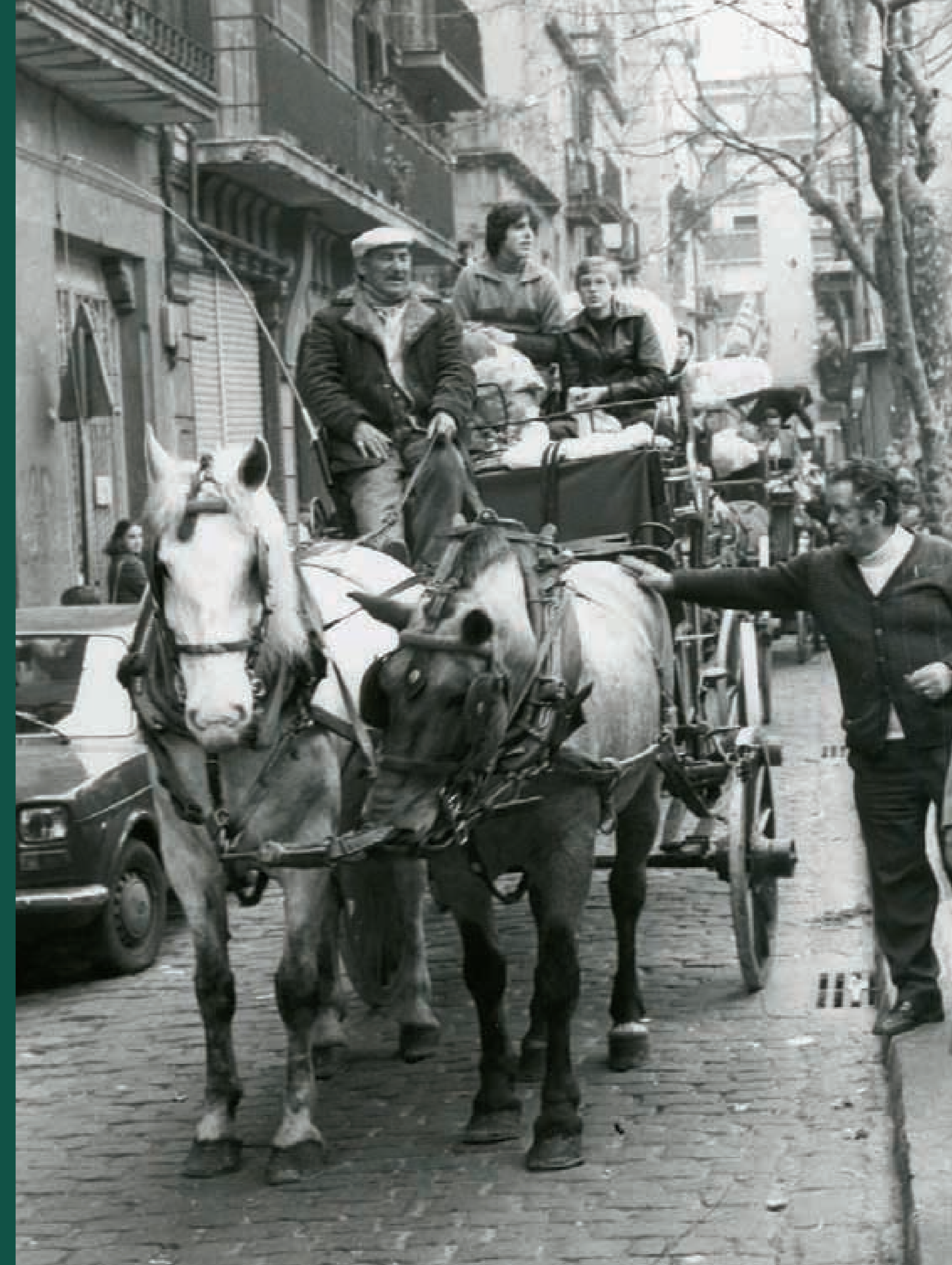
Sant Medir. Barri de Gràcia, 1980.

Durant la festa del barri en un carrer guarnit, s'hi solen ajuntar, en el treball comunitari i en més d'un àpat col·lectiu, un nombre significatiu de veïns i familiars de la zona més propera al carrer. Són els dies de l'any en què es manifesta de forma més vistosa la sensació de comunitat.