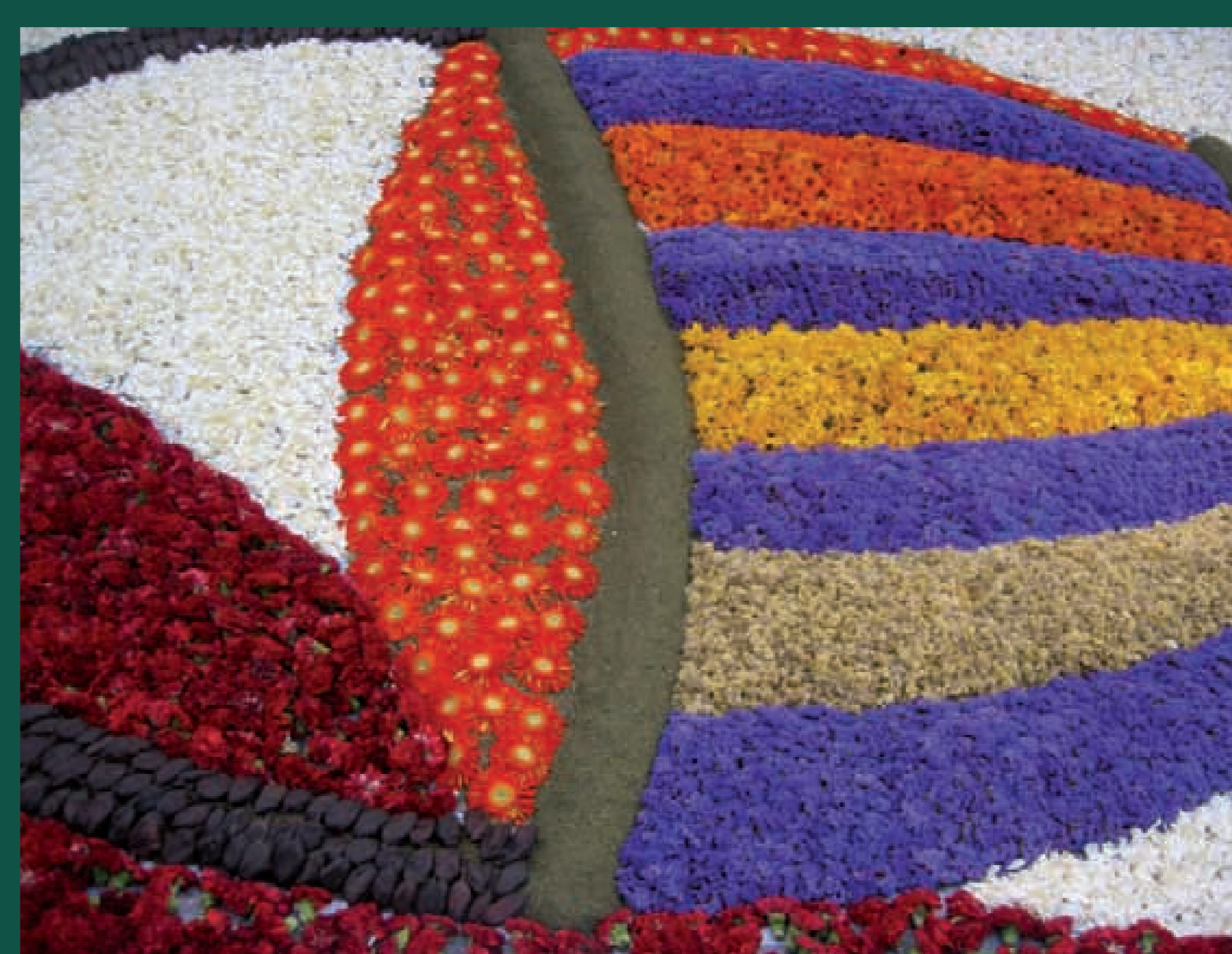
Catifa de flors, Corpus. Sitges, 2011.