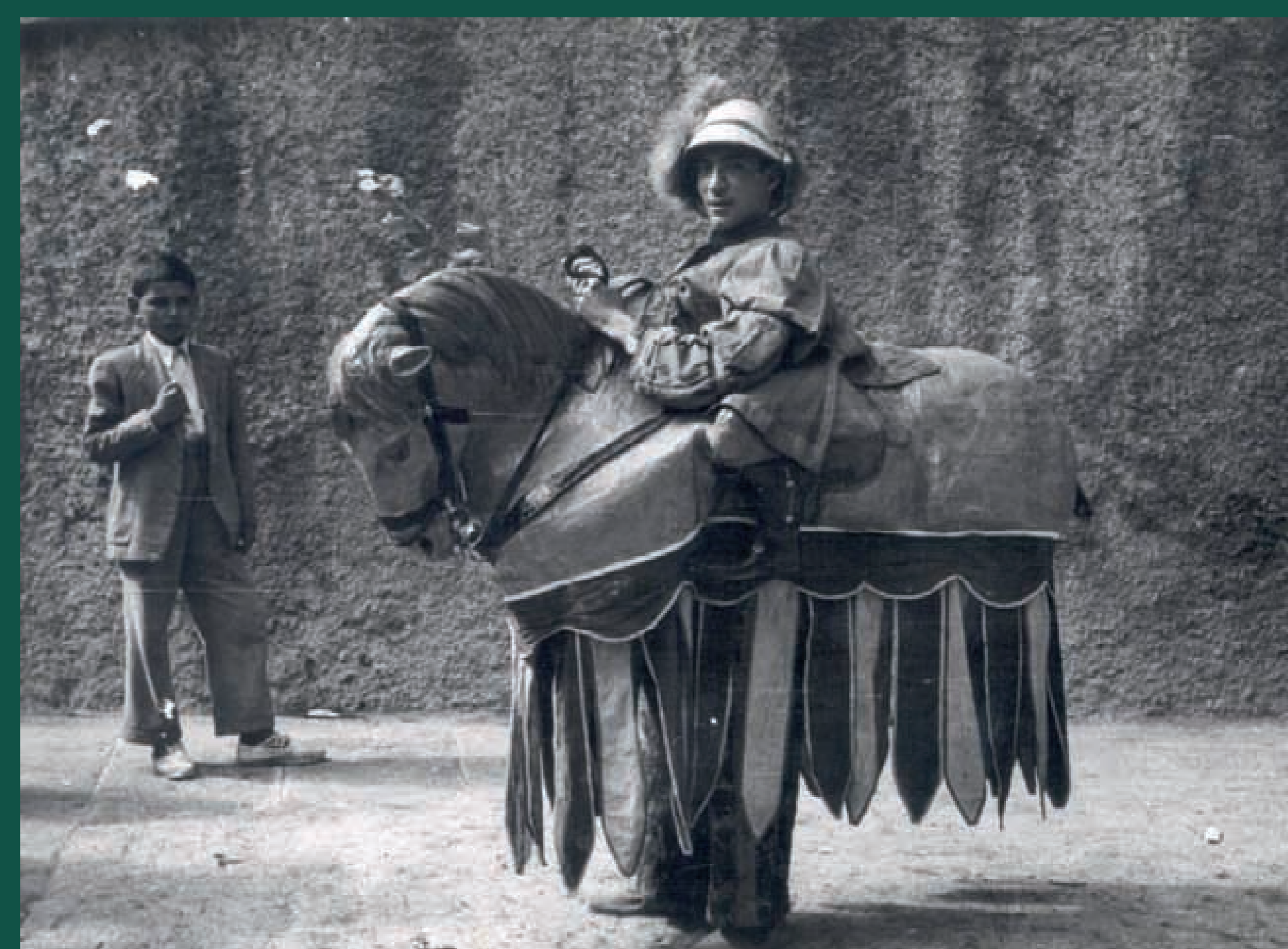
Cavallets del ball de Turcs i Cavallets. La Patum. Berga, 1947.

Es fa complicat escatir el simbolisme original dels elements que formen part de la Patum i la seva evolució durant prop de sis centúries, ja que han anat variant al llarg del temps i no sempre n'ha quedat constància. La Patum és una festa que s'ha de veure i viure. Per a qui no l'ha viscuda, és molt difícil entendre-la. La Patum no la conformen tan sols les comparses, sinó que engloba el marc natural de la representació, la gent que hi assisteix, unes dates de celebració concretes i la tradició actualitzada. Aquesta amalgama constitueix un dels veritables valors de la Patum. L'altre és el conjunt de sentiments que desperta. En la Patum conflueixen instants de misteri, d'alegria, de passió, de goig, de recolliment, d'èxtasi... És la festa dels sentits i dels sentiments.