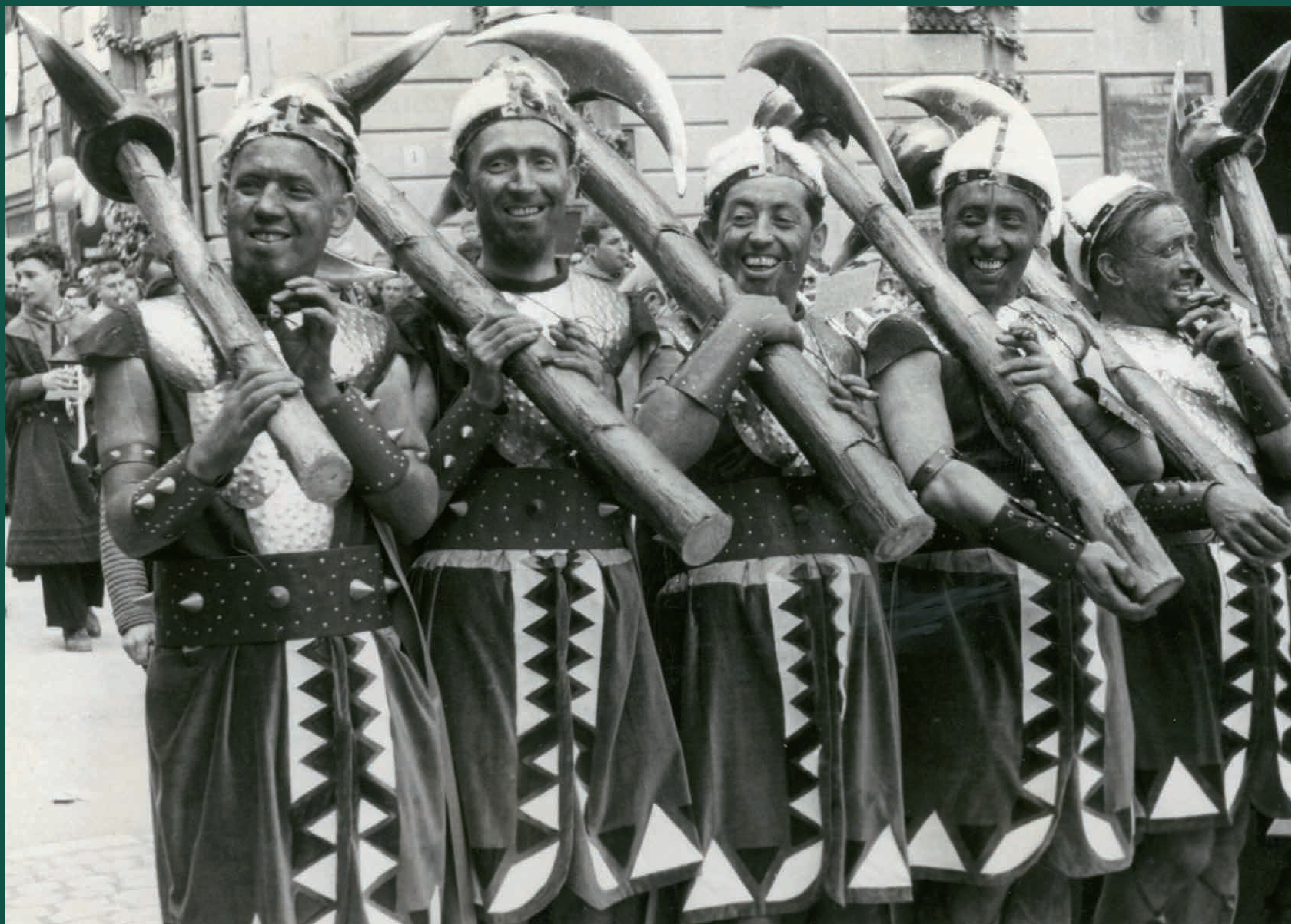
Festa de Moros i Cristians. Alcoi, 1952.