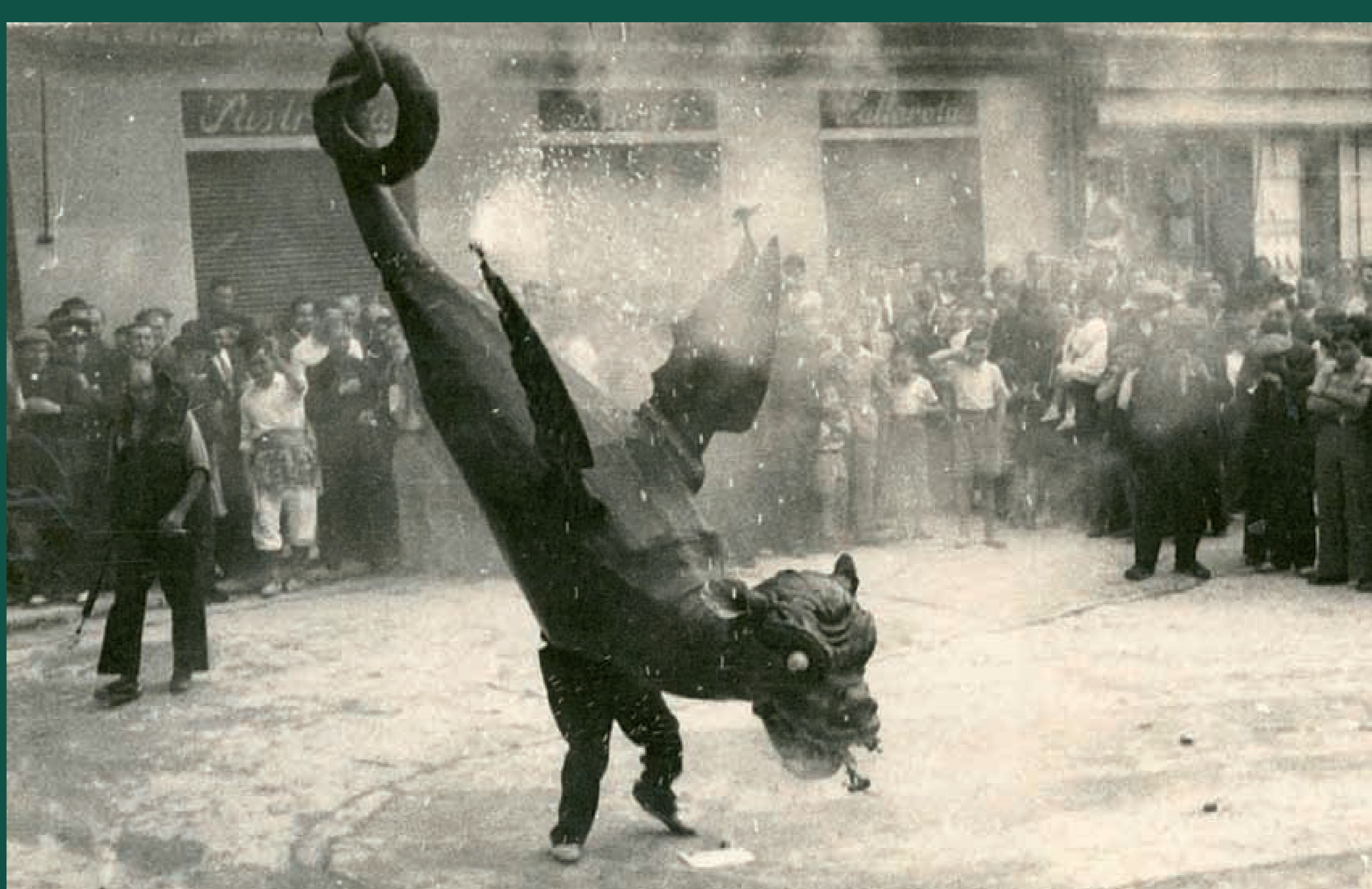
El Drac de Vilafranca, 1947.