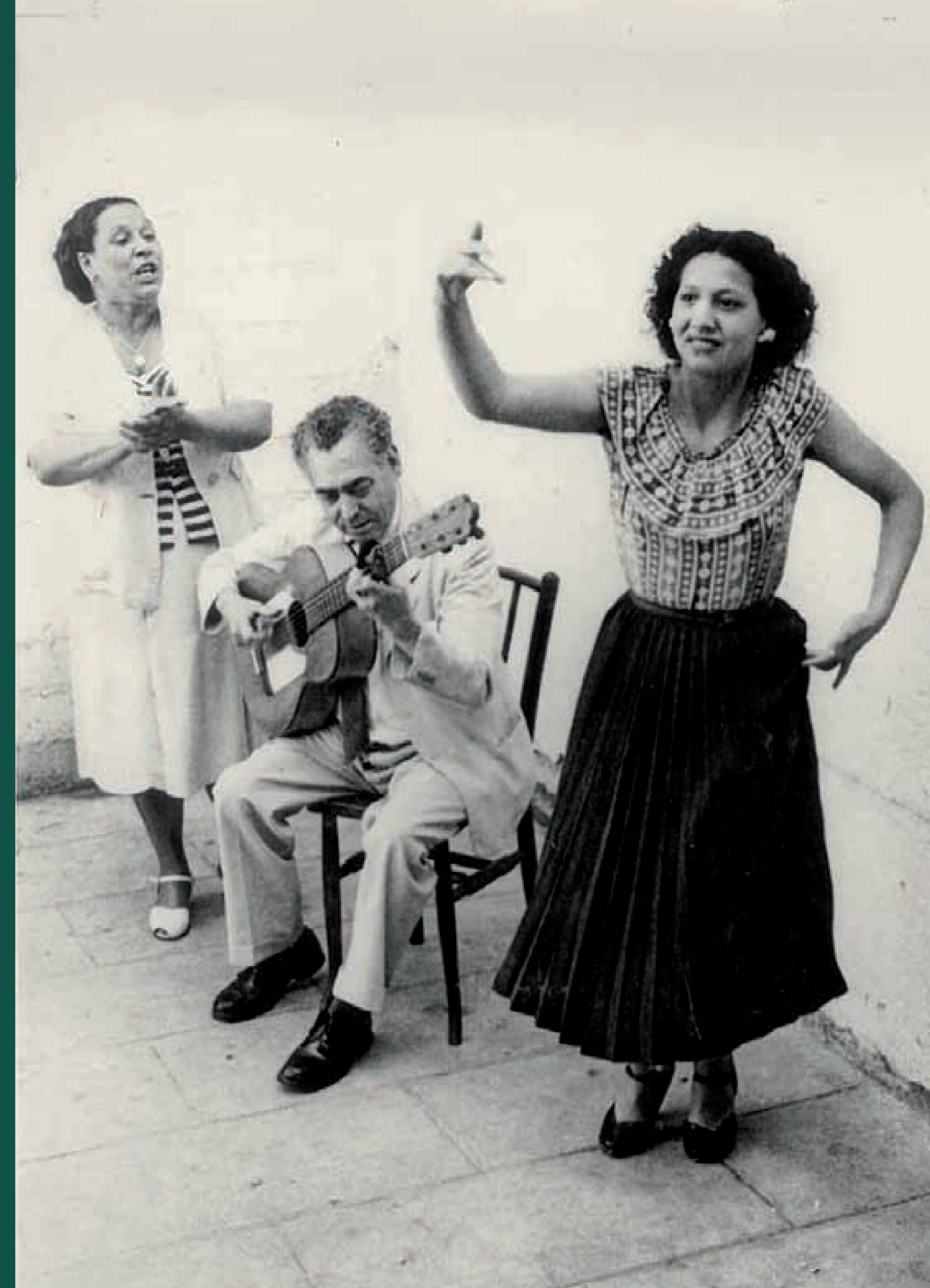
Gitans en un pati al carrer de la Llibertat. Gràcia, 1949. Arxiu Municipal del Districte de Gràcia.

Aquest patrimoni immaterial català va quedar proscrit des del franquisme i bandejat dels escenaris de la cultura oficial.