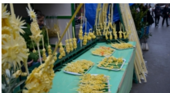
Les fires de Rams de