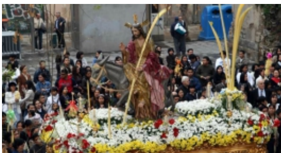
Barcelona viu la Setmana