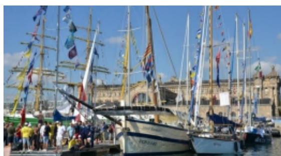
Barcelona reivindica el seu