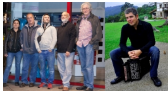
Cloenda del festival