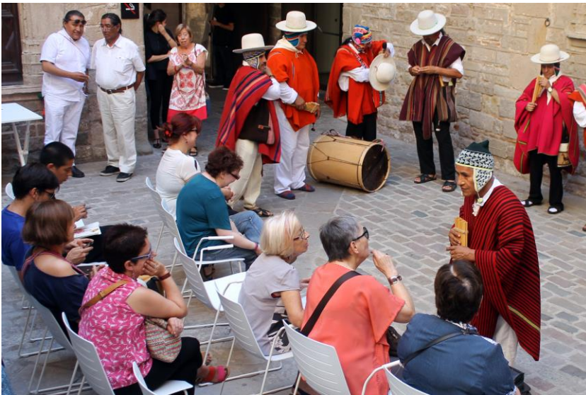
“Danzantes de tijereas” del Perú

Concerts de músiques arrelades a les costums i rituals dels pobles indígenes del subcontinent americà en col·laboració amb Casa Amèrica. Les actuacions de “Mandacaru” del Brasil, “Sikuris” de Bolívia , “Danzantes de tijereas” del Perú i “ Zaracunde” de Panamà, van tenir lloc els diumenges de juliol al Museu de les Cultures del Mon amb l’assistència de 1.220 persones