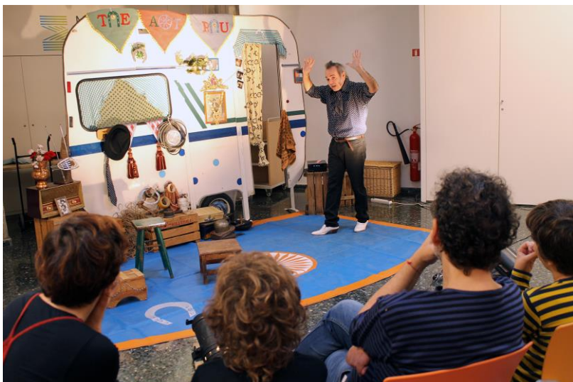
Històries de rulot i carromato - cicle “els diumenges ens movem” al Museu Etnològic