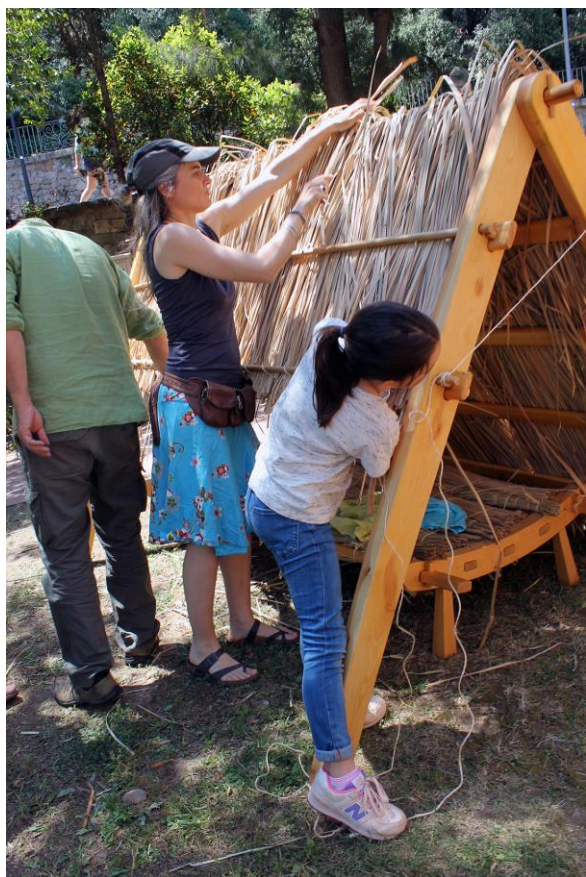
La Cabana del Pastor – cicle “els diumenges ens movem” al Museu Etnològic (Jardins Laribal)