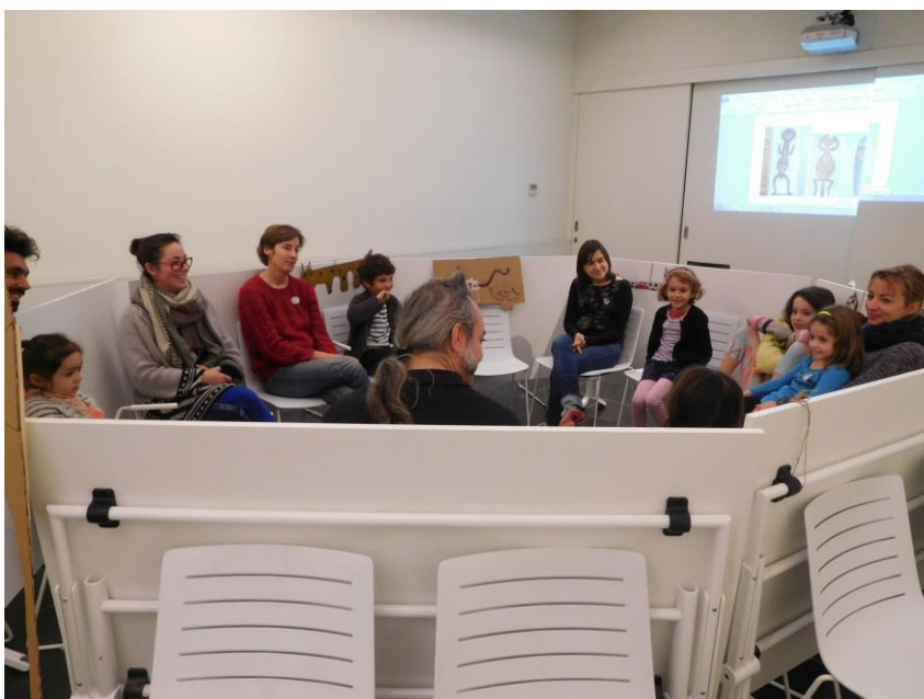
Decorem la nostra casa comunitària– cicle “els diumenges ens movem” al Museu de Cultures del Món

La programació educativa del 2016 amb activitats adreçades a escoles i instituts, a més dels grups d'adults ha estat un dels centres d'interès més destacats, connectant amb una de les funcions principals dels museus, la difusió del patrimoni. Al Museu de Cultures del Món, s'ha donat continuïtat a l'oferta educativa de la temporada anterior 2015-2016 amb la qual es va inaugurar el museu al mes de febrer del 2015 i desenvolupada pels serveis educatius del Museu Egipci. Es tracta d'una oferta educativa adreçada a diferents nivells escolars que proposa visites comentades i tallers –d'enfoc bàsicament artístic- per conèixer tant el conjunt de la col·lecció com cada un dels àmbits geogràfics d'Àfrica, Oceania, Àsia i Amèrica. La visita i taller per a primària Els colors i els somnis de la Terra ha estat el més demanat i per a secundària Fent camí per la vida: rituals de pas . El curs del 2015-2016 es va tancar al juny al MCM amb un total de 98 grups, dels quals 1.739 eren escolars, 454 adults i 135 acompanyants, sumant un total de 2.328 persones. Al MEB, van ser 33 grups, amb un total de 126 escolars, 601 adults i 30 acompanyants, sumant 757 persones en total. A partir del mes de setembre i amb el nou curs 2016-2017, hem ampliat l'oferta educativa a les dues seus amb tallers