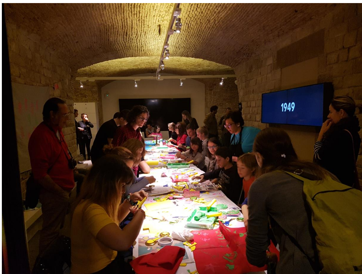
Big Draw, taller de dibuix familiar al Museu de Cultures del Mon

Sota aquest epígraf s'agrupen les activitats en col·laboració amb altres entitats que són tutelades des de l'ICUB. Ens referim a les jornades de Portes obertes dels dos equipaments amb motiu de la celebració de grans esdeveniments i que gaudeixen d'una notable assistència de públic, com ara: LlumBCN (9.869 visitants al MCM), la Nit dels Museus, amb accions artístiques acordades amb els fàbriques de creació; La caldera en el MEB amb 951 assistents i l'Hangar en el MCM amb 6.548 assistents, 48H OpenHouse ( 200 al MCM i 76 al MEB), El Big Draw o taller de dibuix familiar organitzat conjuntament amb el museu Picasso, amb 216 assistents al MCM. Per últim, la jornada de Portes obertes durant la festivitat de la Mercè amb 872 visitants al MCM i 75 al MEB.