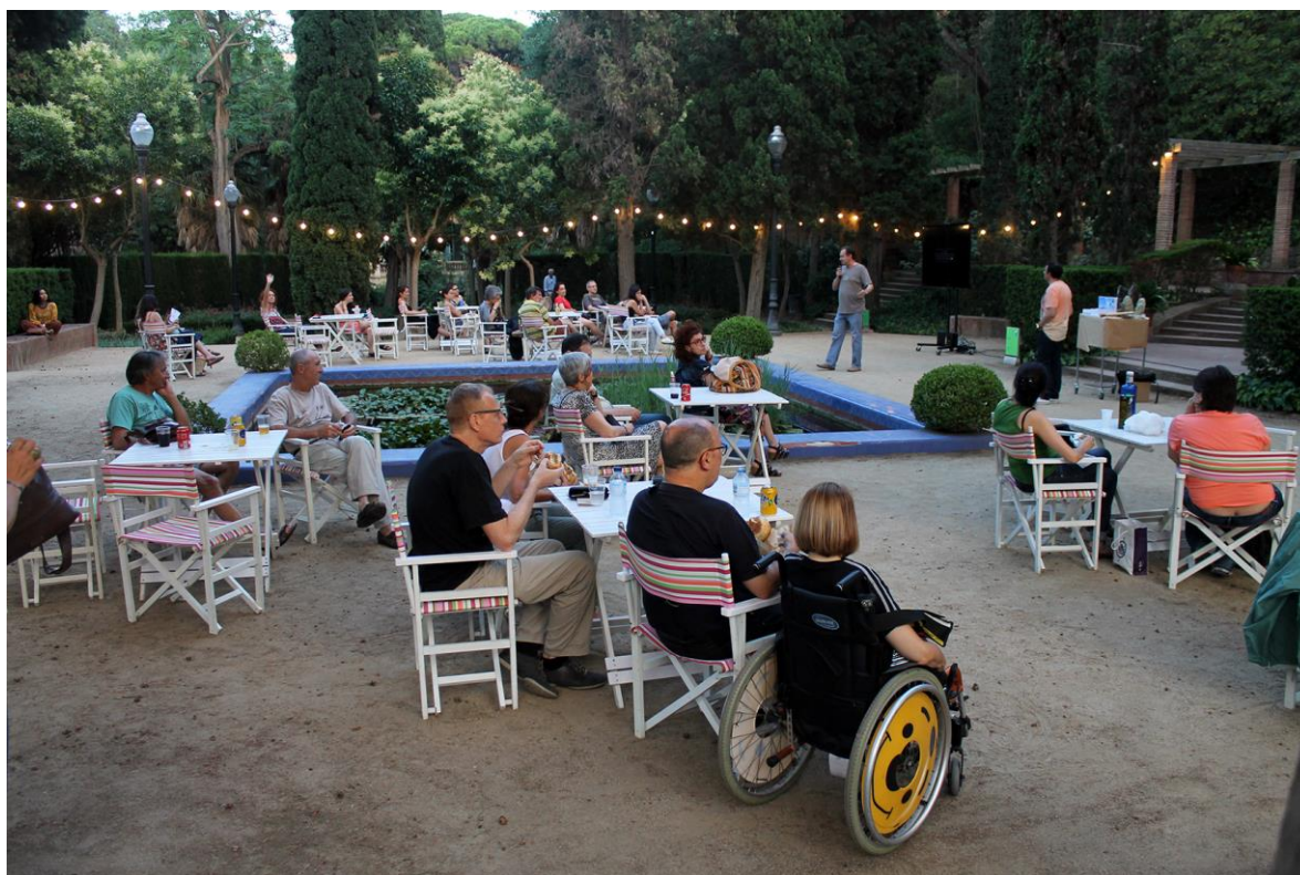
Cinema a la fresca a l'exterior del Museu Etnològic de Barcelona (Jardins Laribal)